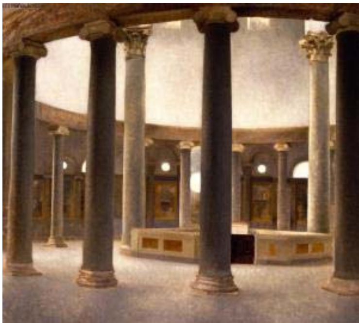
Det indre af S.Stefano Rotondo i Rom. 1902. Vilhelm Hammershøi (1864 – 1916). 67.3 x 72.8. Olie på lærred. Fyns kunstmuseum (nu Brandts Klædefabrik, Odense)

Andre kunstnere er blevet inspireret af dette af dette meget specielle kirkerum. fx Hammershøi der var i Rom 1902-3 og maalede under sit ophold dette stemningsfulde billede af Sant Stefano: